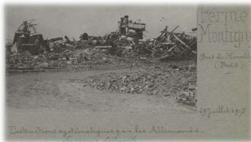
...puis une autre du 29 juillet 1917