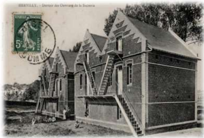
Dortoir des ouvriers de la sucrerie d'Hervilly-Montigny (Carte postale 1924).