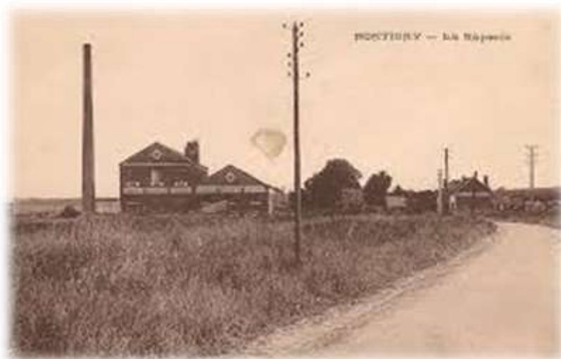
Une vue panoramique de l'ancienne râperie...